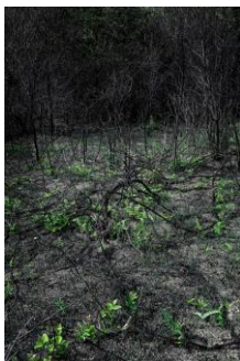
《無題 01》 蕭偉恒