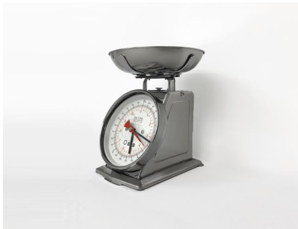
《現在重量是？》，謝俊昇, 混合媒介, 2020