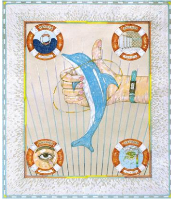
《某個泳池的入口（二） -捕獲海豚先生》 陳惠立